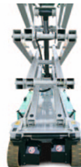
Design nou al sasiului permite curatarea usoara si asigura protectia componentelor